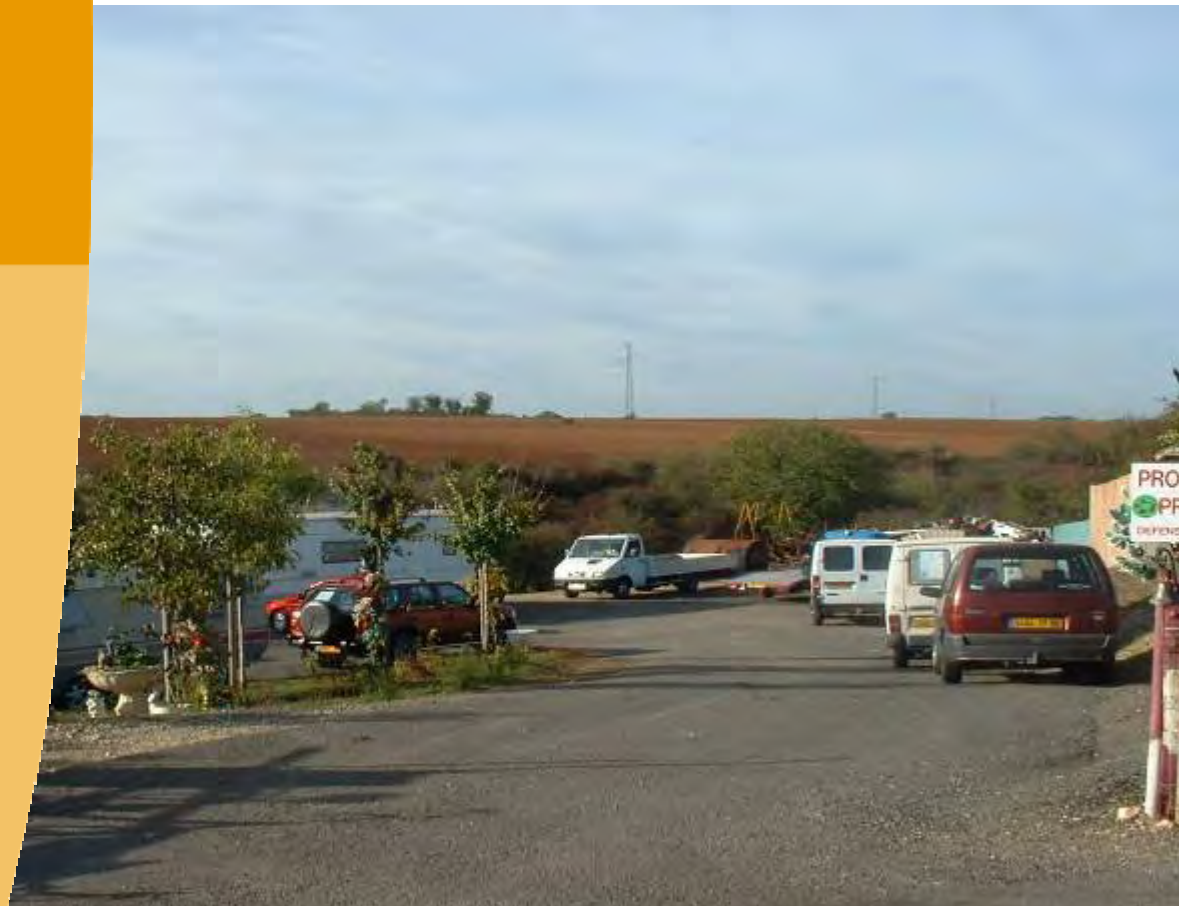
Schéma départemental d'accueil, d'habitat et d'insertion des gens du voyage 2009-2015

Ressourcement, territoires et habitats Énergie et climat Développement durable Prévention des risques Infrastructures, transport et Air